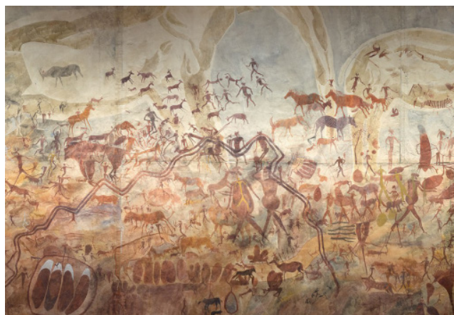
Grands éléphants, autres animaux et figures humaines, aquarelle de Joachim Lutz reproduisant les peintures rupestres de Mutoko