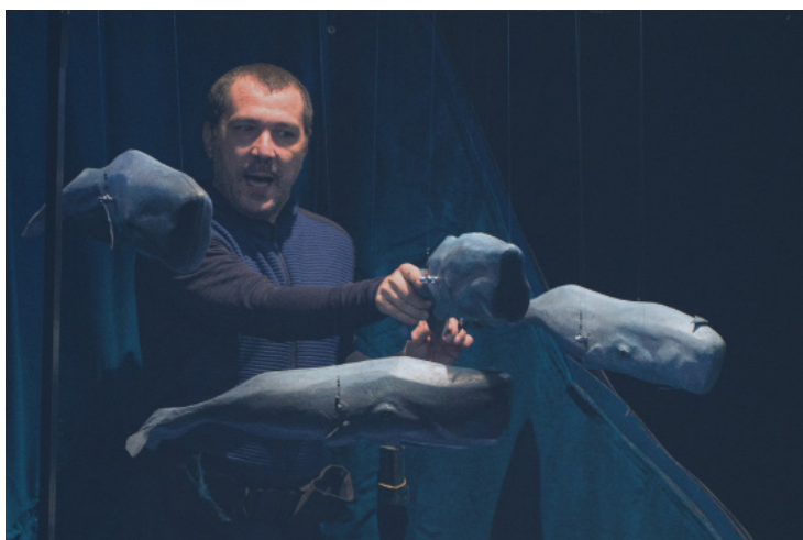
Spectacles Les Acrobates & BUFFLES