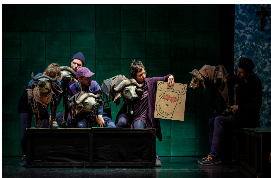
Marionnette végétale - la digitale pour la fable «L'agneau a menti»