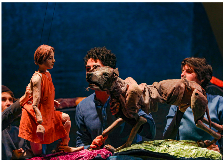
Prototype castor ppur NOTRE VALLEE