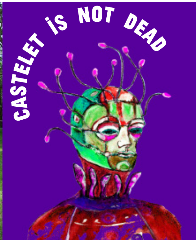
/ dessin préparatoire Emilie Flacher

• Projet de création > SAISON 1 / CRÉATION JUIN 24