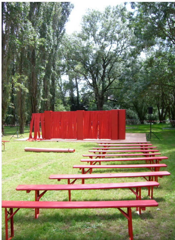
castelet de jardin Cie Emilie Valantin